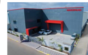
RINGSPANN Power Transmission India Pvt. Ltd., India