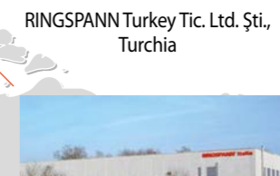
RINGSPANN Turkey Tic. Ltd. Şti., Turchia