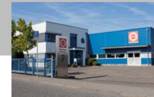
RINGSPANN RCS GmbH, Germania Produzione Sistemi di Controllo Remoto