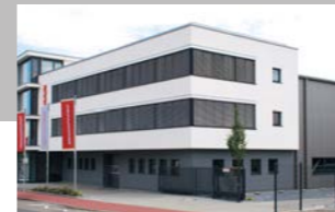
RINGSPANN GmbH, Germania Produzione Freni, Giunti, Mandrini di precisione e Calettatori