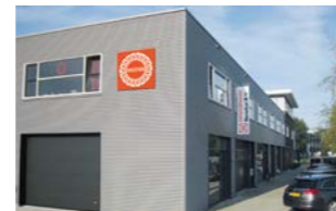
RINGSPANN Benelux B.V., Paesi Bassi