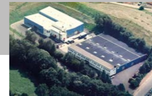
RINGSPANN Kempf GmbH, Germania Produzione Giunti Cardanici