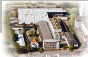
RINGSPANN GmbH, Germania Quartier Generale e Produzione Ruote Libere

Trasmissioni di Potenza Mandrini di Precisione Sistemi di Controllo Remoto