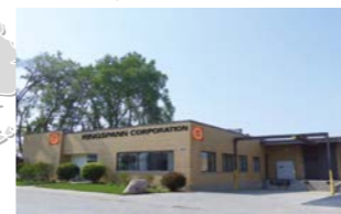
RINGSPANN CORPORATION, USA