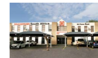
RINGSPANN South Africa (Pty) Ltd., Sudafrica