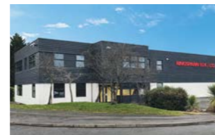
RINGSPANN (U.K.) LTD., Gran Bretagna