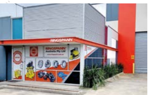
RINGSPANN Australia Pty Ltd, Australia