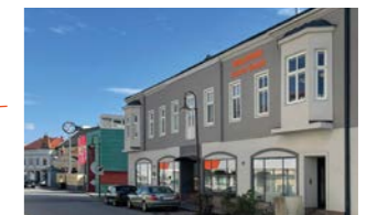
RINGSPANN Austria GmbH, Austria