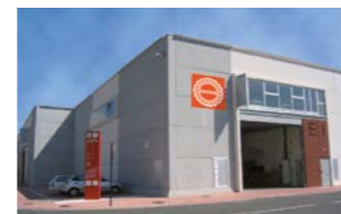
RINGSPANN IBERICA S.A., Spagna