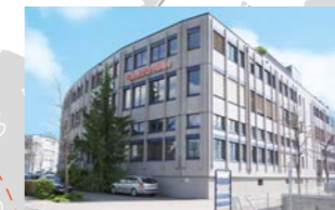
RINGSPANN AG, Svizzera