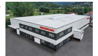
RINGSPANN Bosanska Krupa d.o.o., Bosnia Erzegovina