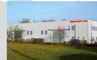
RINGSPANN Italia S.r.l., Italia