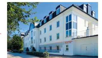
RINGSPANN Nordic AB, Svezia