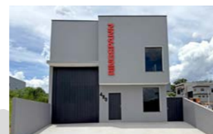
RINGSPANN do Brasil Ltda., Brasile